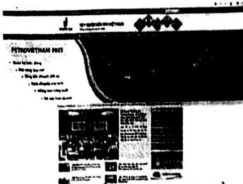
Website chính thức của Tập đoàn Dầu khí Việt Nam sử dụng tên miền quốc gia ".vn" (pvn.vn)